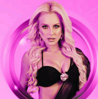
RIO G. DO SUL